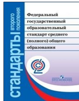
Примерный учебный план